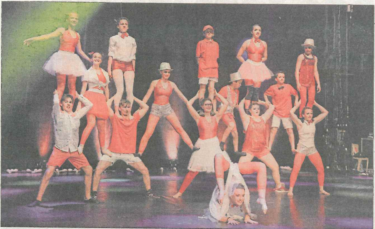
Une grande famille en rouge et blanc.