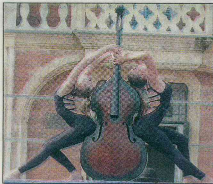
Le numéro sur la contrebasse a déjà conquis le public.

Juste avant les fêtes de fin d'année, différents numéros ont été filmés puis envoyés aux sélections de La piste aux espoirs, un festival international de cirque qui se déroule à Tournai en Belgique depuis vingt-cinq ans. L'objectif de La piste aux espoirs est de promouvoir le renouveau des arts du cirque en invitant des artistes sélectionnés pour leurs propositions originales, la qualité dans la présentation et la performance technique.