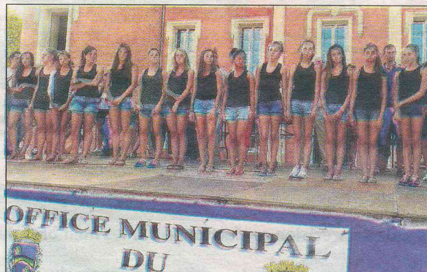
Les gymnastes de l'UGCS récompensées.

Q uelques jours après la rentrée scolaire, ce sont les associations qui ont repris leurs activités.